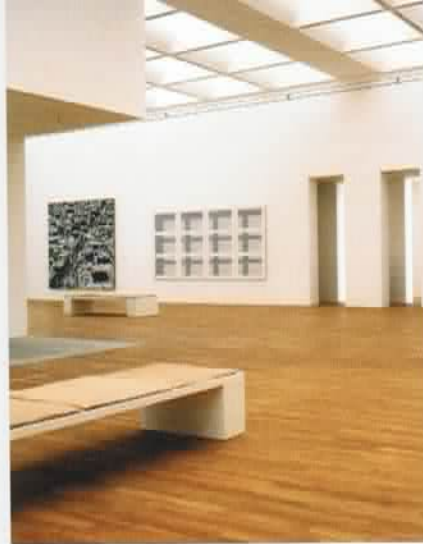
Die Werke warten auf Betrachter