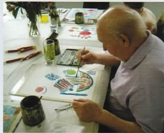
Eine reiche Bilderwelt entsteht